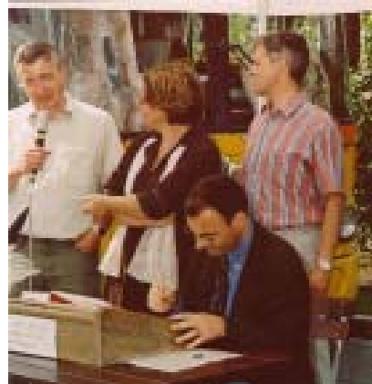
OB Renner auf der Landesgartenschau

Zum Auftakt der Sommerferien bot das Bildungszentrum Singen zusammen mit der Badischen Landesbibelgesellschaft und der Bibelgalerie Meersburg neue Attraktionen im und ums Kirchenzelt auf der Landesgartenschau. Die Ausstellung im Kirchenzelt „Himmliche Gärten – Vom Paradies zur Goldenen Stadt“ mit 100 Original Egli Erzählfiguren zog täglich zwischen 1500-2000 Besucher an. Gleichzeitig bot der große Berliner Bibelbus, das BIBELMOBIL, ein interessantes Programm aus der neuen deutschen Metropole. Nach der Ausstellungseröffnung beteiligte sich der Singener Oberbürgermeister Renner an der Entstehung der ersten handgeschriebenen Bibel der Neuzeit. Zum Vergnügen der Anwesenden und auch vieler Mitarbeiter im Rathaus musste