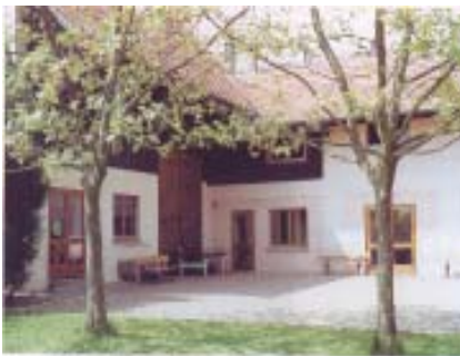
La Petite Vigne

Petite? Es war im Gegenteil eine große Sache, zu der sich rund dreißig Bildungswerkleiterinnen und -leiter aus dem ganzen Erzbistum im Elsaß trafen. Und es war das erste Mal, dass Direktoren im Verbund mit der AG "Ehrenamtliche" solche Einladung ausgesprochen haben: gemeinsam ein Wochenende von Freitag bis Sonntag in legerer Atmosphäre zu verbringen. Dass unter dieser Maßgabe die jeweiligen Ehepartner mit eingeladen waren, versteht sich - und erhöhte den Zweck der "unverzweckten Übung". Man stand und saß zusammen, un petit rouge ou blanc in Händen und das ebenso typische Käsehäppchen in der Nase. Der Direktor höchstpersönlich hatte mit seinen Gehilfen in der ortsansässigen Winzergenossenschaft vorgesorgt, und nachdem im Laufe des fortgeschrittenen Freitagnachmittags (22. September) die Gäste peu à peu aus allen Himmelsrichtungen eingetroffen waren, konnte es losgehen: inhaltlich und strategisch. Um mit letzterem zu beginnen: Als Domizil hatte man absichtlich keines von der höheren Sterne-Kategorie gewählt; eher handfestes Herbergsniveau, wo es Möglichkeiten genug gab, selber anzupacken. Selbstversorger at its best, phasenweise freilich mit einheimischer Unterstützung, in Küche und