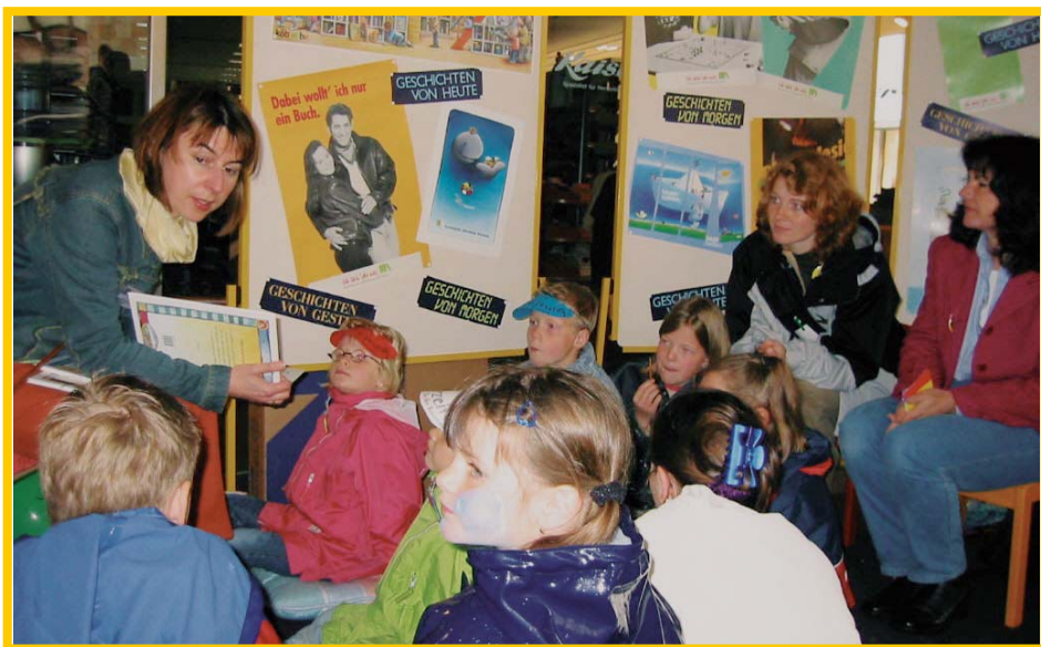
Mütter und Kinder hören beim Bistumsjubiläum 2002 spannenden Geschichten zu.

In zwei Kreis-AG-Tagungen haben die Teilnehmerinnen und Teilnehmer den Wunsch geäußert, dass zu diesem Thema für die Arbeit in den örtlichen Bildungswerken Informationen, Anregungen und konkrete Hilfestellungen zur Verfügung gestellt werden.