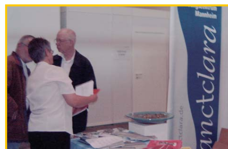
Der Stand auf dem Ökumenischen Kirchentag

nen Stand in der Agora vertreten mittendrin und dabei, dass Ökumene in etwas mehr als einer Generation von der Ausnahme zur Selbstverständlichkeit geworden ist. Äußeres und wichtiges Zeichen dafür war die feierliche Unterzeichnung der „Charta Oecumenica“ durch 16 Kirchen in Deutschland. Die Charta gilt als ökumenischer Meilenstein und hat das Ziel, „die unter uns noch bestehenden Spaltungen zu überwinden.“ Sie wird, auch wenn sie die Form einer Absichtserklärung ist, ein Vorbild für den Dialog der Kirchen in der Gesellschaft sein.