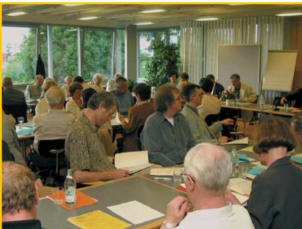
Nahezu 60 ehren- und hauptamtliche Mitarbeiter/-innen bei der Jahresversammlung in der katholischen Akademie.

Akzenten im Angebot und entscheidend vor allem durch freundlichen Umgang und Akzeptanz der Leserinnen und Lesern mit ihren Wünschen und manchmal auch Nöten in der personalen Begegnung verfolgen die Büchereien zukunftsweisende Ziele in Richtung Qualitätsmanagement .